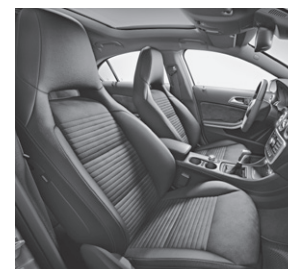
Polsterung Ledernachbildung ARTICO/Microfaser DINAMICA schwarz (651)