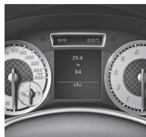
COLLISION PREVENTION ASSIST (252) (Abb. mit sportl. Kombiinstrument bei Lines oder Paketen)