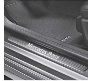
Einstiegsleiste beleuchtet, Bestandteil Licht- und Sicht-Paket (U62)