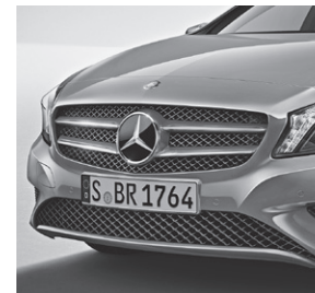
Kühlergrill mit zwei Lamellen in Wagenfarbe und Chromeinleger