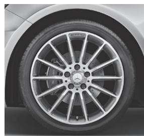
45,7 cm (18") AMG Leichtmetallräder im Vielspeichen-Design (791)