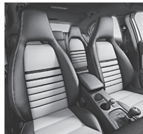
Ledernachbildung ARTICO Stoff schwarz / weiß (455)