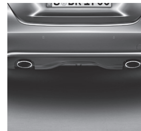
zweiflutige Abgasanlage mit ovalen Endrohrblenden in poliertem Edelstahl