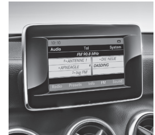
Audio 20 CD (523)