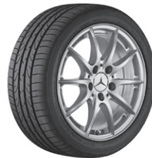
40,6 cm (16") Leichtmetallrad im 5-Doppelspeichen-Design