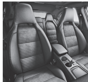
Polsterung Ledernachbildung ARTICO/Mikrofaser DINAMICA (651)