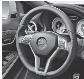
Multifunktions-Sportlenkrad unten abgeflacht