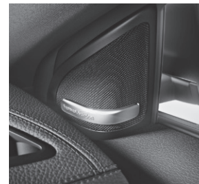
Harman Kardon® Logic 7® Surround-Soundsystem (810)