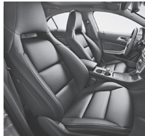
Sportsitze vorne beheizt mit Polsterung Leder