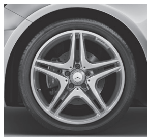
45,7 cm (18") AMG Leichtmetall- räder im 5-Doppelspeichen-Design (794)