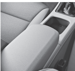
Armauflage mit Ablagefach