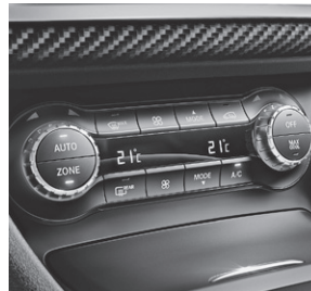
Klimatisierungsautomatik THERMOTRONIC (581)