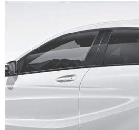
Wärmedämmend dunkel getöntes Glas ab B-Säule (840)