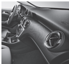
Stoff schwarz (001), Zierelement Wabenoptik