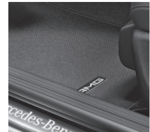
Fußmatten Cord mit schwarzem Keder und Ziernaht in Rot mit AMG Schriftzug