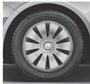
40,6 cm (16") Stahlräder mit Radzierblenden im 10-Loch-Design (643)