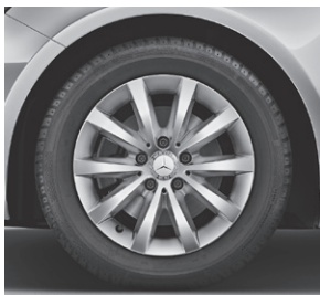
40,6 cm (16") Leichtmetallräder im 10-Speichen-Design (55R)