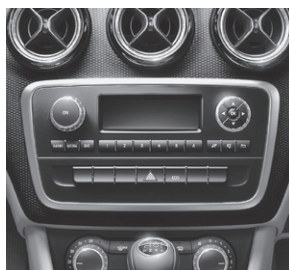
Audio 5 USB Radio (516)