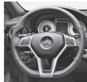
Multifunktions-Sportlenkrad (280), Perforation im Griffbereich und unten abgeflacht