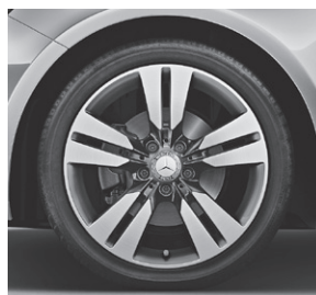
45,7 cm (18") Leichtmetallräder im 5-Doppelspeichen-Design (R38)