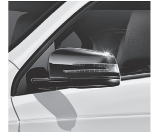
Aussenpiegel schwarz lackiert