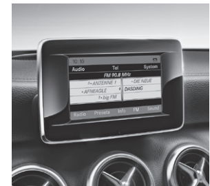
Audio 20 CD (523)