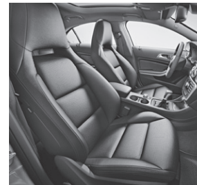
Sportsitze vorne beheizt mit Polsterung Leder schwarz RED CUT (811)