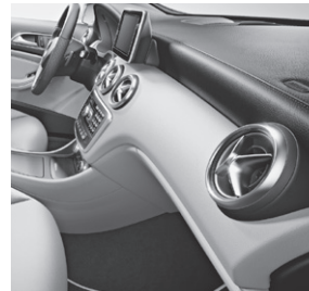
Zierelement in Ausstattungsfarbe