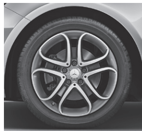
43,2 cm (17") Leichtmetallräder im 5-Doppelspeichen-Design (R48)