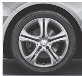
43,2 cm (17") Leichtmetallräder im 5-Doppelspeichen-Design (R11)