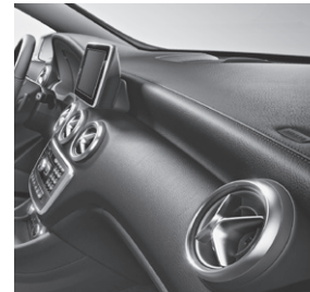
Instrumententafel in Ledernachbildung ARTICO