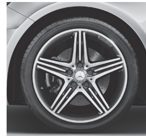
45,7 cm (18") AMG Leichtmetallräder im 5-Speichen-Design (774)