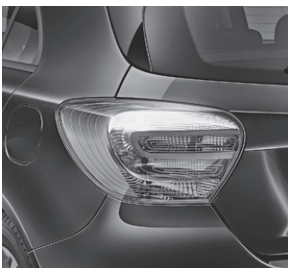
Schlussleuchte mit aktiviertem Bremslicht