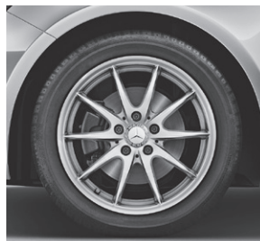
43,2 cm (17") Leichtmetallräder im 10-Speichen-Design (25R)