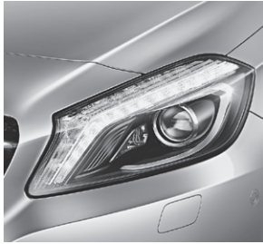
Intelligent Light System (622)