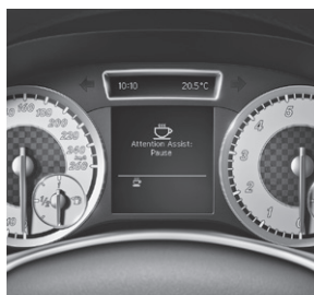
ATTENTION ASSIST (538) (Abb. mit sportl. Kombiinstrument bei Lines oder Paketen)