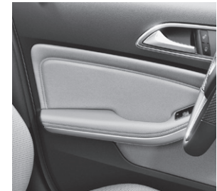
Türmittelfelder in Ledernachbildung ARTICO mit Kontrastziernähten