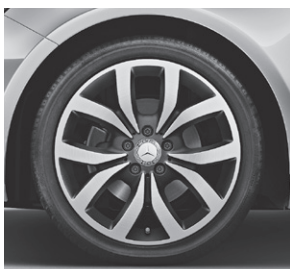
45,7 cm (18") Leichtmetallräder im 5-Doppelspeichen-Design (R10)