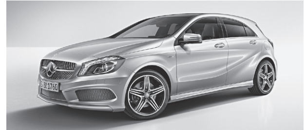
A 250 Sport