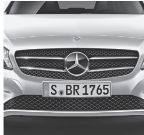
Kühlergrill schwarz glänzend mit Chromeinlagen