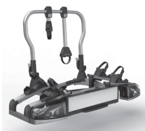
Heckfahrradträger für Anhängervorrichtung