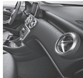
Zierelement in Carbonoptik