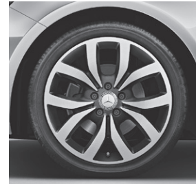
45,7 cm (18") Leichtmetallräder im 5 Doppelspeichen-Design (R10)