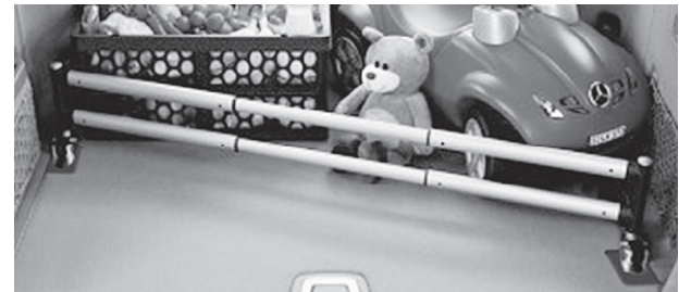
Steckmodul Kofferraum (Abbildung ähnlich)