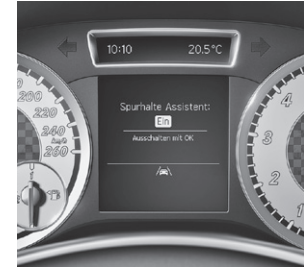
Spurhalte-Assistent, Spur-Paket (22P)