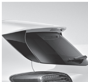
Radioantenne in Dachspoiler integriert