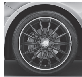
45,7 cm (18") AMG Leichtmetall- räder im Vielspeichen-Design (646)