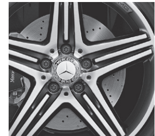
Bremsscheiben vorne gelocht