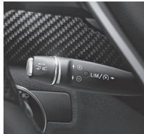
DISTRONIC PLUS (239)