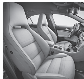
Ledernachbildung ARTICO Stoff Larochette kristallgrau (368)