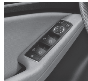
Fensterheber elektrisch 4-fach (584)