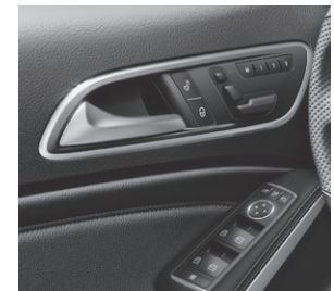
Fahrersitz elektrisch verstellbar mit Memory-Funktion (275)