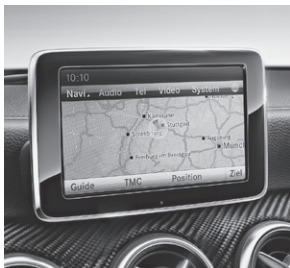
COMAND Online (527)