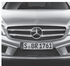
Kühlergrill silberfarben lackiert mit Chromeinlagen