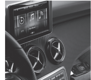
Drive Kit Plus