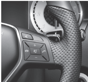
DIRECT SELECT Wählhebel in Verbindung mit 7G-DCT (429)