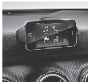
Drive Kit für das Apple® iPhone® 4/4S (B22)