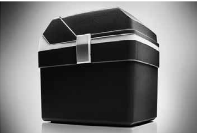
Kühl-/Warmhaltebox, elektrisch. Portabel, 18 Liter Volumen.