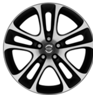
Atreus 7,5 x 18"