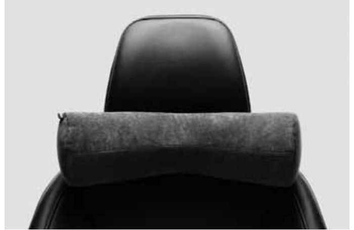
Komfortkissen. Weich gepolstertes Nackenkissen zur Befestigung an jeder Kopfstütze. Bezug abnehmbar und waschbar.