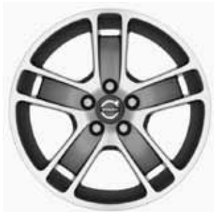
Zaurak Graphit/Silber 7,0 x 17"