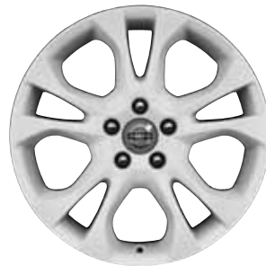
Styx White 7,0 x 17"