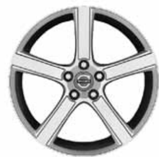
Midir 7,5 x 18"