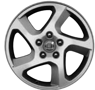
Convector 6,5 x 16"