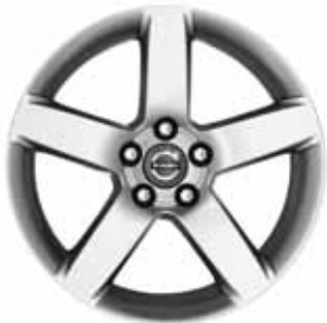
Serapis 7,0 x 17"

2) Nicht in Verbindung mit Sportfahrwerk.