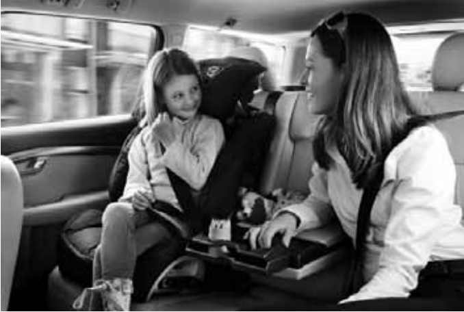
Gurtkissen mit Rückenlehne. Gruppe III, für Kinder von ca. 15 bis 36 kg Körpergewicht. Erfüllt die Normen ECE R44-04 und Öko-Tex Standard 100.