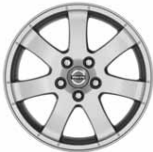
Cordelia 6,5 x 16"