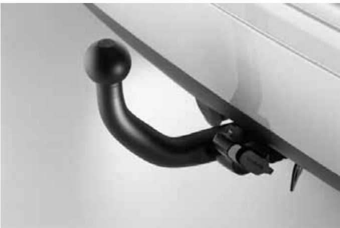
Anhängerkupplung, fest oder abnehmbar.