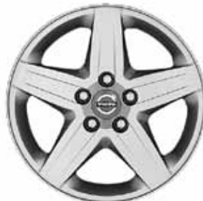
Ceryx 6,5 x 16"