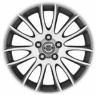
Spartacus 7,0 x 17"