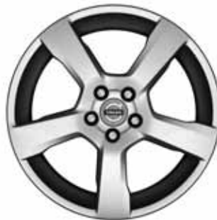
Cratus 7,0 x 17"