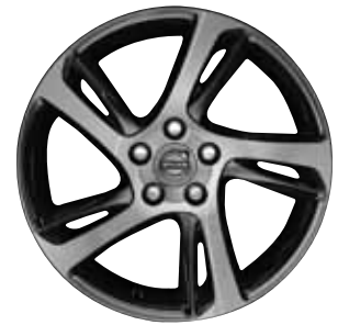
Spider 7,0 x 17"