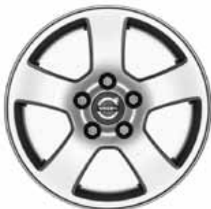
Isis 6,0 x 15"