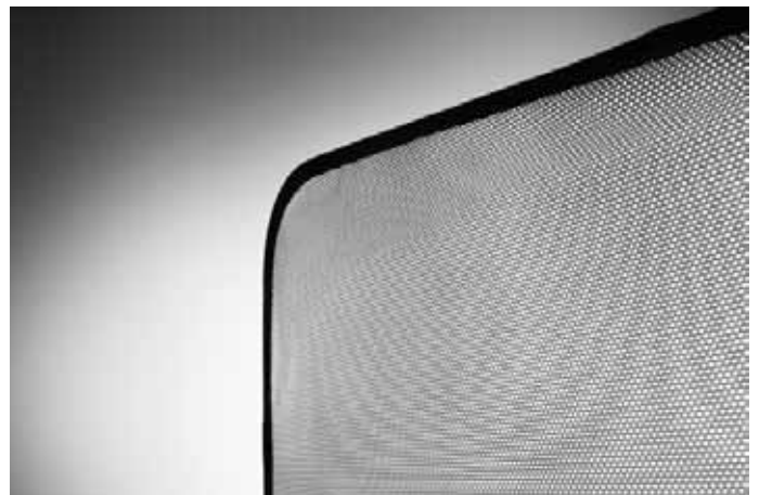
Passform-Sonnenschutzblenden. Für die Hintertüren (Paar) und den Gepäckraum (dreiteiliger Satz) erhältlich. Einfache Klemmbefestigung.