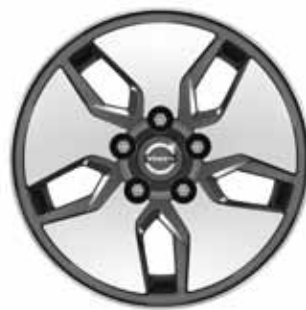
Libra 6,5 x 16"